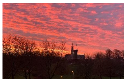
Zonsopgang 11 januari 2022